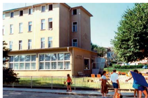
Das Betriebsferienheim Erich Wirth, 1989

Nachdem er dem stark renovierungsbedürftigen Bau zunächst den traditionellen Namen „Strandhotel“ zurückgegeben hatte, wurde in den folgenden Jahren nahezu alles in und um das Haus saniert, restauriert und modernisiert. Vor allem wurden zuerst neue Bäder eingebaut und die