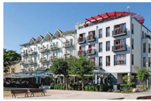
Das Strandhotel Heringsdorf im Sommer 2013

seit FDGB-Zeiten schmucklose Fassade neu gestaltet. Durch den Bau der Nebenhäuser und die Erweiterung des Haupthauses wurden so bis heute 80 attraktive Zimmer und 9 Apartments geschaffen.